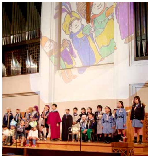
スカウト クリスマス礼拝(豊南坂教会)

TEL 03-6271-3350 (10:00-18:00) 開館時間 10:00-19:00 (入場は 18:50まで) 無休 (年末年始を除く) 〒107-0052 東京都港区赤坂9-7-3