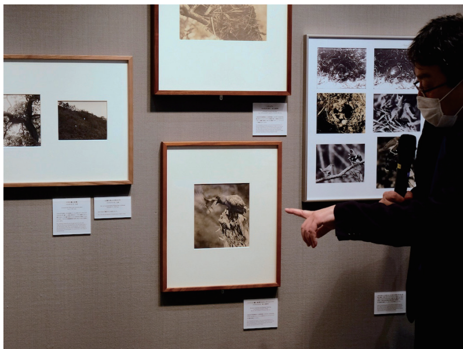
《ツツドリの雛に給餌するセンダイムシクイ》(下) 1930年5月20日 富士山麓須走