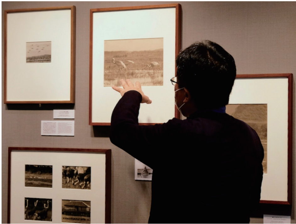
《マナヅル》(右上)と《ナベヅルの降下飛翔》(左上) いずれも 1920 年代後半 鹿児島県荒崎