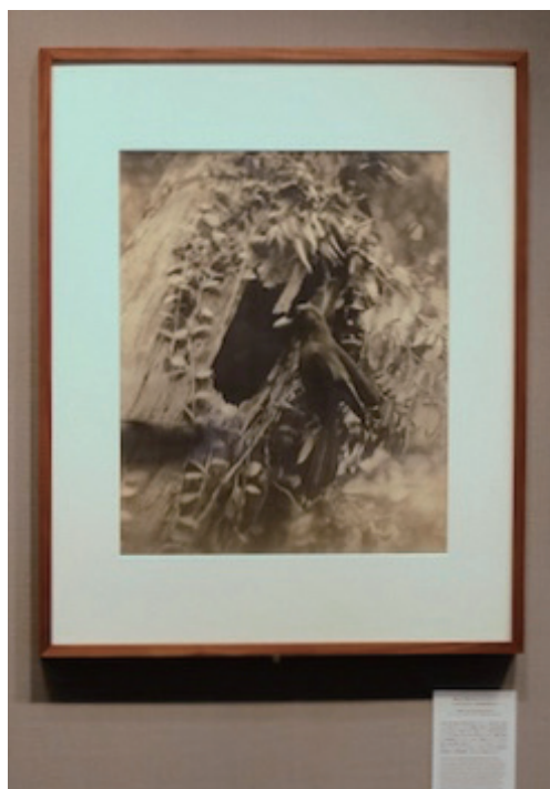
《巣穴に飛び込むルリカケス》 1935年4月20日 鹿児島県奄美大島

平岡 はい。ここまでに紹介した《ナベヅルの降下飛翔》《ツツドリの雛に給餌するセンダイムシクイ》《巣