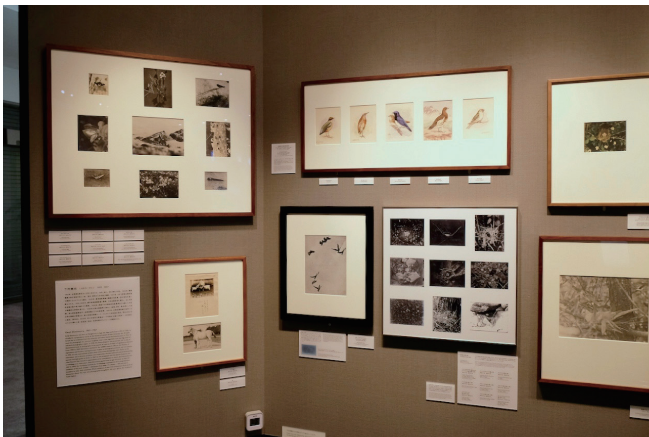
原画（上／横に5点並んでいる作品）と鳥以外の生き物の写真（左）