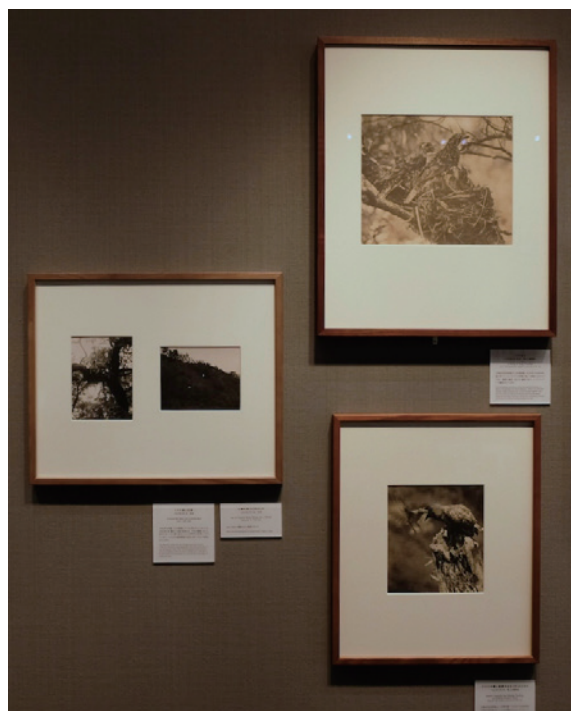
《トラツグミ》(右上) 1929年6月(推定) 富士山麓須走