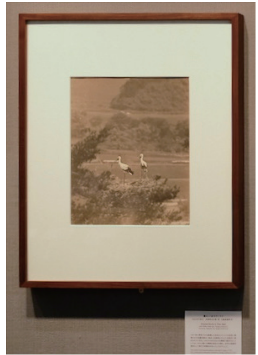
《巢にいるコウノトリ》