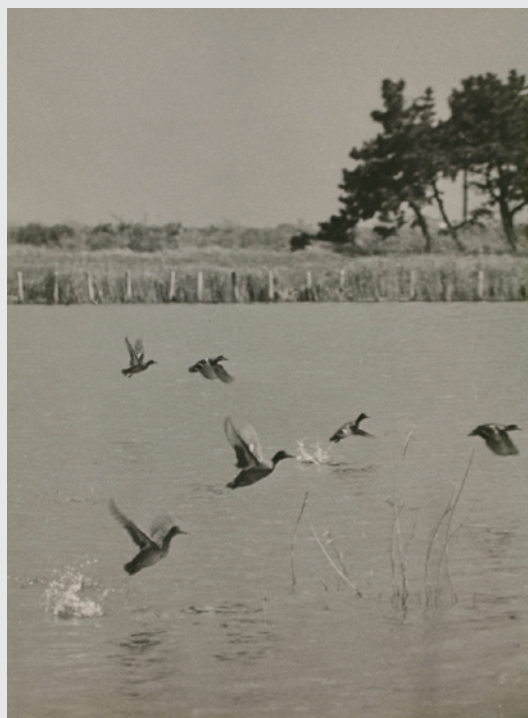
《コガモ》撮影年不詳 千葉県新浜