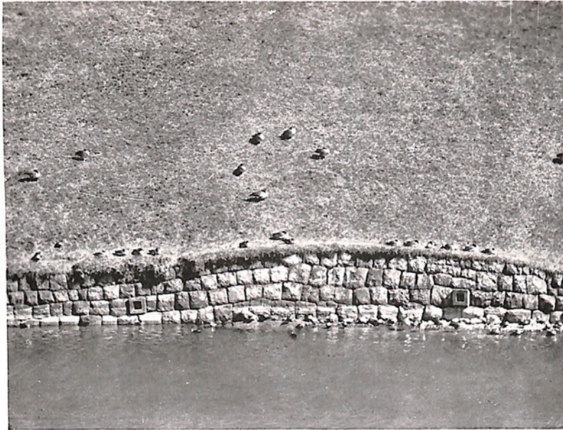
お濠に眠るヒシクイの群