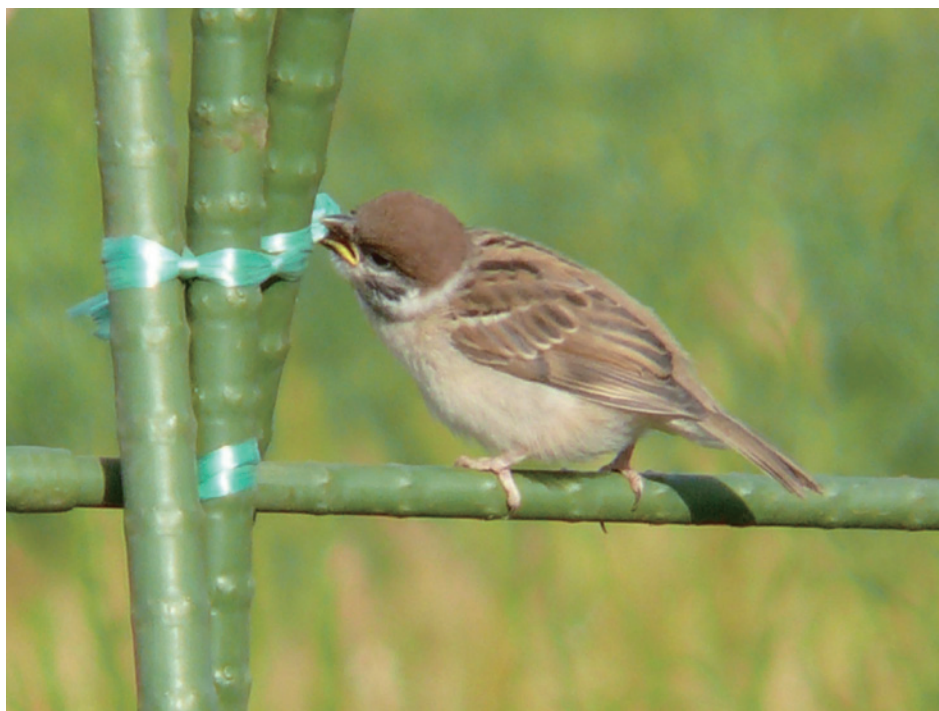
ビニールひもをくわえるスズメの幼鳥 「目立つものが気になるようで、青いひもをくわえようとしている」

安西 若い鳥は飛行や着地が下手だったり、採食や生理的な行動（後半で解説する水浴びや羽繕いなど）もぎこちなかったりします。食べられないものを食べようとするなど、経験を積んだ成鳥ならするはずがない