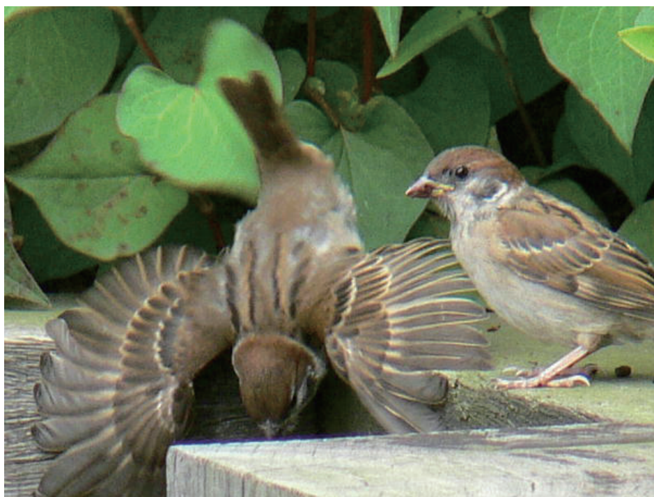
こけたスズメの幼鳥

「幼鳥は成鳥より顔の黒斑が淡く、翼の白い線が目立たない。 左の幼鳥は足を滑らせて落ちそうになり、翼を広げた」