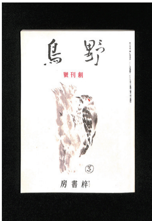
『野鳥』誌創刊号(1934年)表紙 (写真は復刻版)