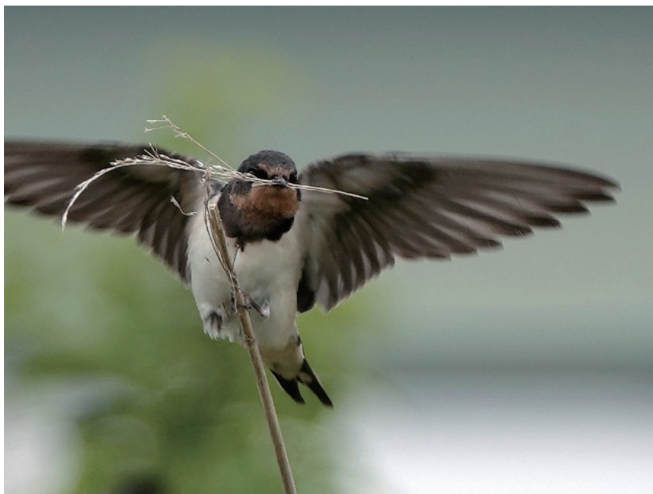
枯草をくわえたツバメの幼鳥

「成鳥より尾が短いので、幼鳥とわかる。食べられない枯草をつまんでいるのは好奇心からだろうか」