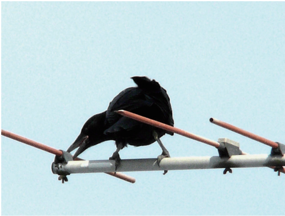
アンテナをつつくハシボソガラスの幼鳥 「カラス類の幼鳥は口の中が赤い。アンテナのつなぎの部分が気になるようだが、成長するにつれこのような無駄な行動はしなくなるはず」